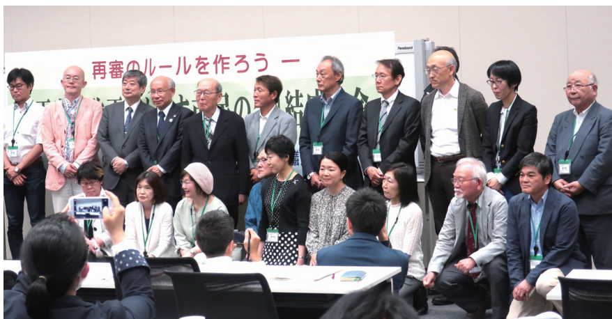
再審法改正をめざす市民の会結成集会で選出された運営委員（2019年5月20日）